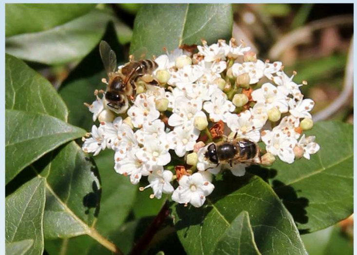
Ape e sirfide su viburno laurotino

Per ulteriori informazioni è possibile contattare i tecnici del C.A.A. "Giorgio Nicoli" S.r.l. (051/6802227) rferrari@caa.it