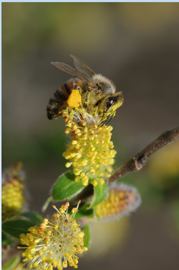
Ape su salicone